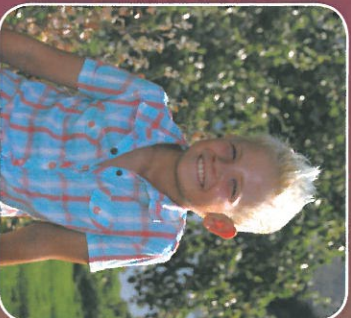
Hereu Infantil Arnau Aguilà Artiol